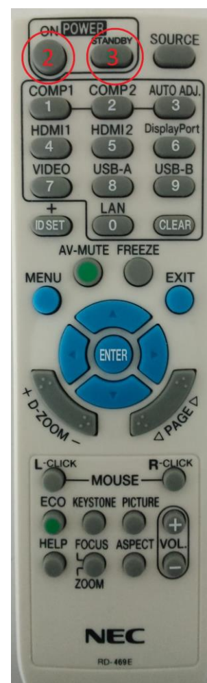
Rys. 2. Pilot projektora