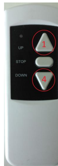
Rys. 1. Pilot ekranu